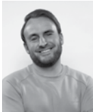
Boy Kolman UI Designer